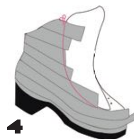
4 Découpe de l'excédent