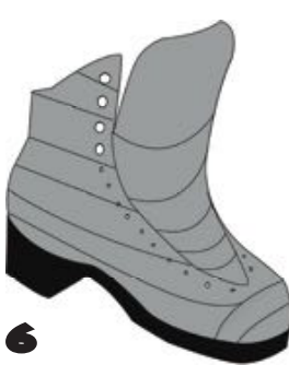
6 Protection languette facultative