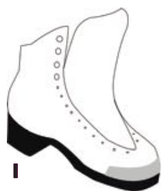
1 Application sur la base (2cm)