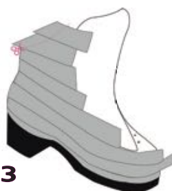
3 Découpe haut de tige