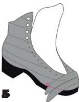
5 Pose croisée avant