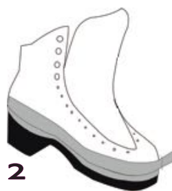
2 Renfort botte (4cm)